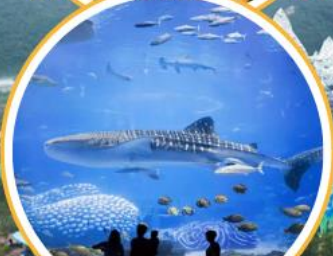
อควาเรียมใหญ่ที่สุดในโลก