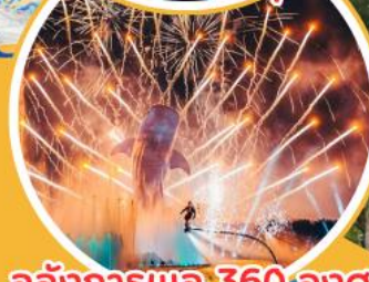
อลังการพลุ 360 องศา