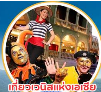
เที่ยวเอเชียแห่งเอเชีย