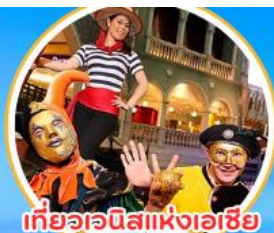
เที่ยวอะนิเมะแห่งเอเชีย