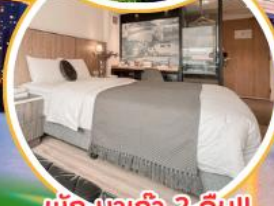
พัก มาเก๊า 2 คืน!!