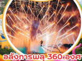
อลังการพลุ 360 องศา