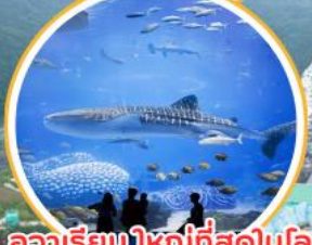
อควาเรียมใหญ่ที่สุดในโลก