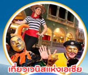
เที่ยวเวนิสแห่งเอเชีย