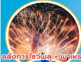
อลังการโชว์ไฟพลุ + พายโรด