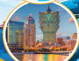
เที่ยวมาเก๊า