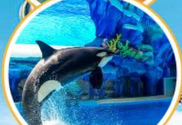
Orca Show สุดน่ารัก